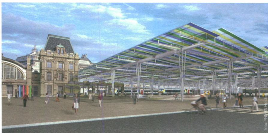
Zicht op het toekomstige stationsplein in Oostende