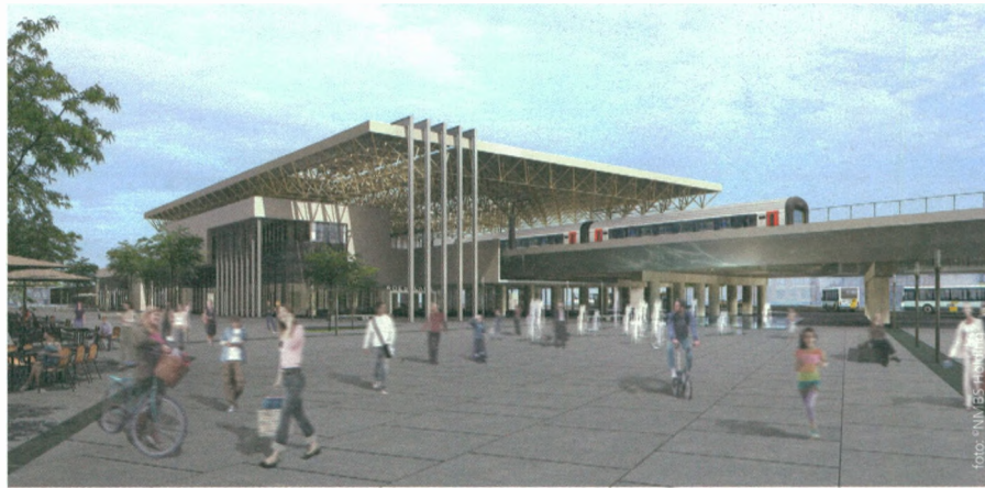
Toekomstzicht op achterkant stationssite Roeselare

De Lijn bouwt een nieuw comfortabel busstation met vlot toegankelijke busperrons en schuilhuisjes. De NMBS-Holding, Infrabel, de stad Roeselare en De Lijn investeren samen bijna 37 miljoen euro in de vernieuwing van de stationsomgeving Roeselare. Afronding van het project is voorzien in 2015.