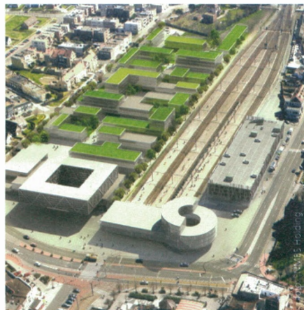
Grote plannen voor ontwikkeling rond station Blankenberge

Door de vele gebouwen die vandaag naast het treinstation staan, te vervangen door een enkel bouwvolume en door de ernaast gelegen bus- en tramstelplaats te verplaatsen, wordt een verkeersluw open plein gecreëerd. De projectpartners NMBS-Holding, Infrabel, De Lijn en de stad Oostende investeren samen 150 miljoen euro in een project dat loopt tot midden 2017.