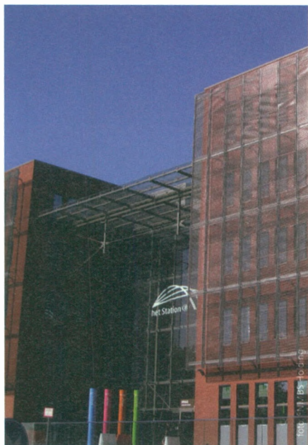
Station Brugge kreeg er 41.000 m 2 kantoren bij

Het stationsproject van Oostende startte in 2011 en reikt veel verder dan het stationsgebouw en de aanpalende perrons. Niet alleen wordt het treinstation gerenoveerd en heringericht, er komt ook een